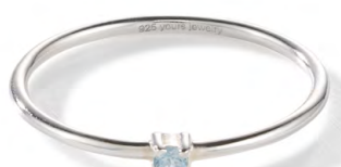
RS12-018 W: 15 € Birdie Ring Silver Farbe: blissful blue Stone size: 2 mm 925 Sterling silver Stone: Light blue Topaz