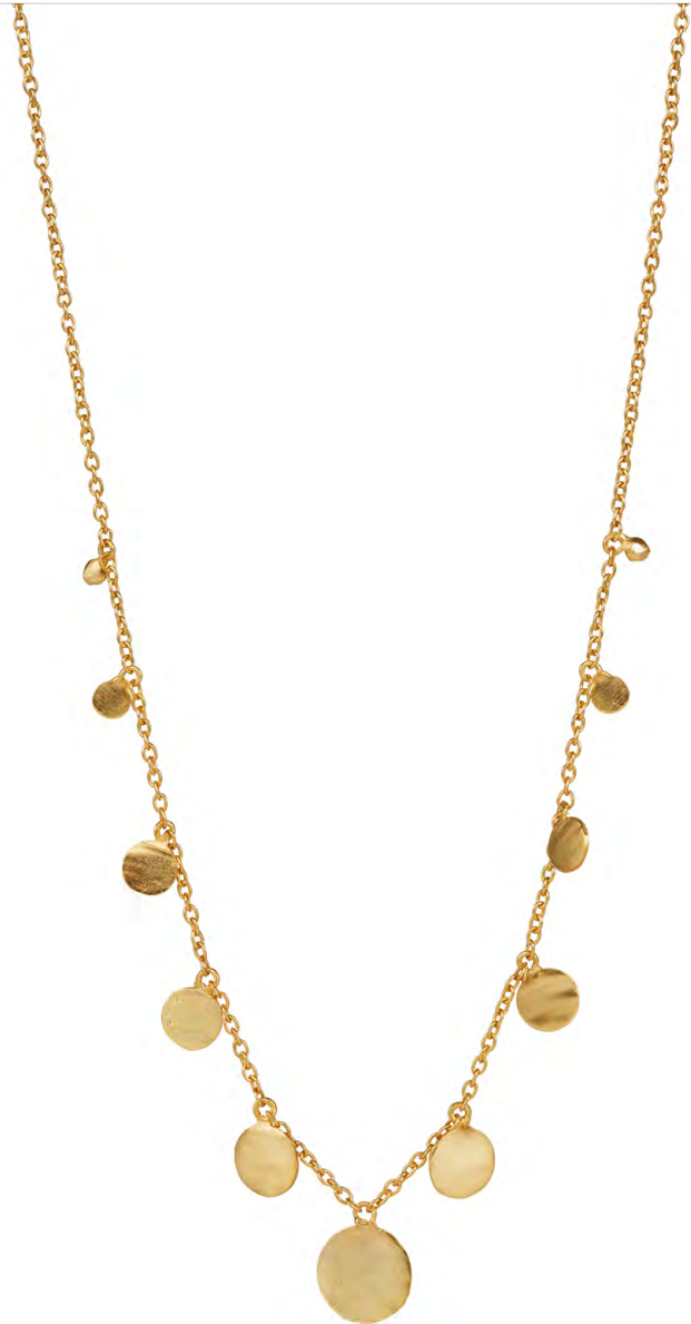
NG10-038 W: 40 € Shimmering Spring Necklace No 1 Colour: gold rush Length: 16/18 inch (40/45 cm) Sterling silver 24 carat gold plated