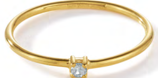
RG12-018 W: 19 € Birdie Ring Colour: blissful blue Stone size: 2 mm Sterling silver 24 carat gold plated Stone: Light blue Topaz