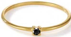
RG12-004 W: 19 € Birdie Ring Farbe: the dark night Stone size: 2 mm Sterling silver 24 carat gold plated Stone: Black Spinel