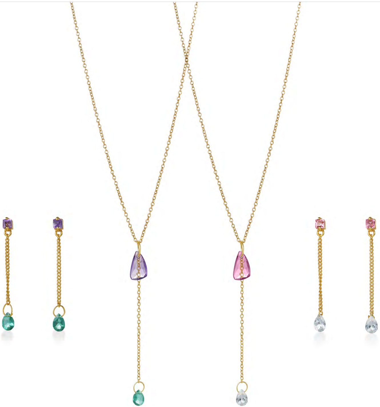
EG11-066 W: 28 € Falling Water Earring Colour: crocus Size: 6 cm Sterling silver 24 carat gold plated Stones: Amethyst, Green Tourmaline