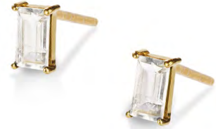
EG11-026 W: 35 € Savoy Ceremony Stud Colour: clear as day Stone size: 5 x 3 mm Sterling silver 24 carat gold plated Stone: White Topaz