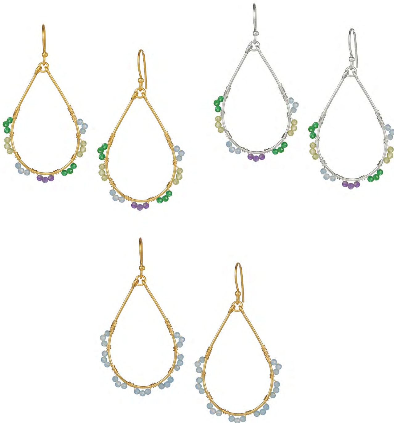
EG11-039 W: 36 € Vamos a la playa Earring Colour: multi Length: 55 x 30 mm Sterling silver 24 carat gold plated Stones: Green Onyx, Citrine, Blue Chalcedony, Amethyst