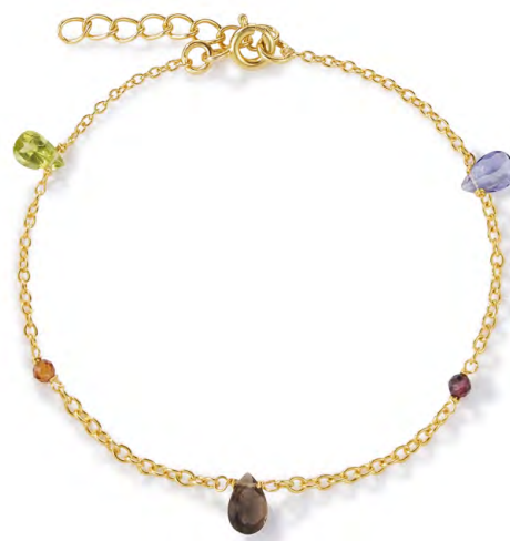
BG13-001 W: 36 € Velvet Garden Bracelet Colour: vineyard Length: 6/7,5 inch (16/19 cm) Sterling silver 18 carat gold plated Stones: Amethyst, Blue Topaz, Peridot, Garnet, Crystal & Citrine