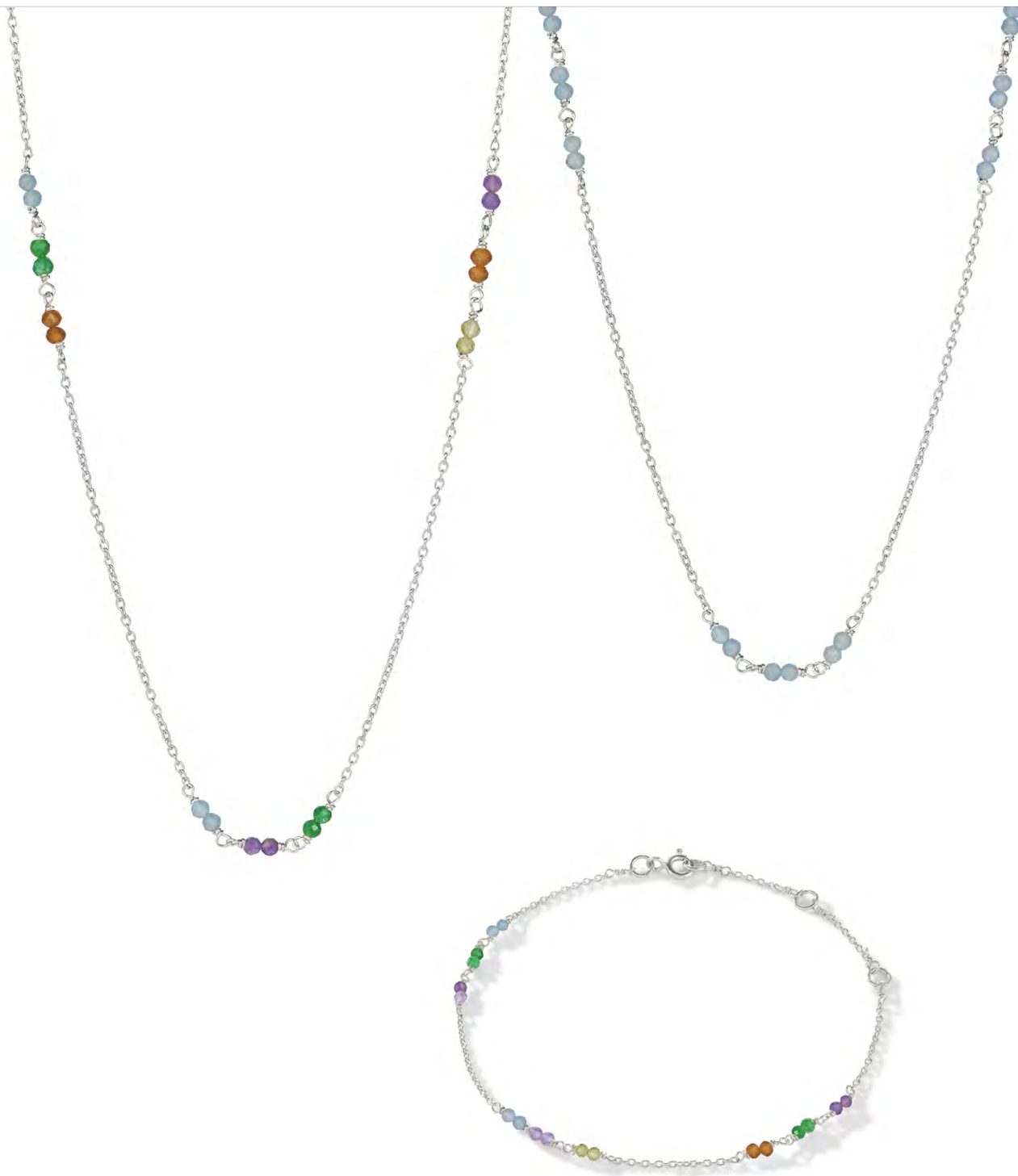
NS10-033 W: 34 € Petit Jardin NL short Silver Colour: multi Length: 16/18 inch (40/45 cm) 925 Sterling silver Stones: Green Onyx, Citrine, Blue Chalcedony, Amethyst