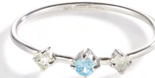
RS12-022 W: 19 € Broken Vintage Ring Colour: milky skylight Stone size: 2,5 / 2 mm 925 Sterling silver Stones: Blue Topaz & Moonstone

Ringgröße 50, 52, 54, 56 Size 5, 6, 7, 8