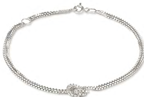
BG13-06 W: 33 € Lucky Knot Bracelet Colour: gold rush Length: 6/7,5 inch (16/19 cm) Sterling silver 24 carat gold plated