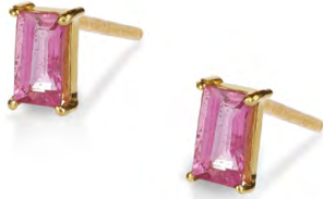
EG11-074 W: 35 € Savoy Ceremony Stud Colour: cozy candy Stone size: 5 x 3 mm Sterling silver 24 carat gold plated Stone: Pink Tourmaline