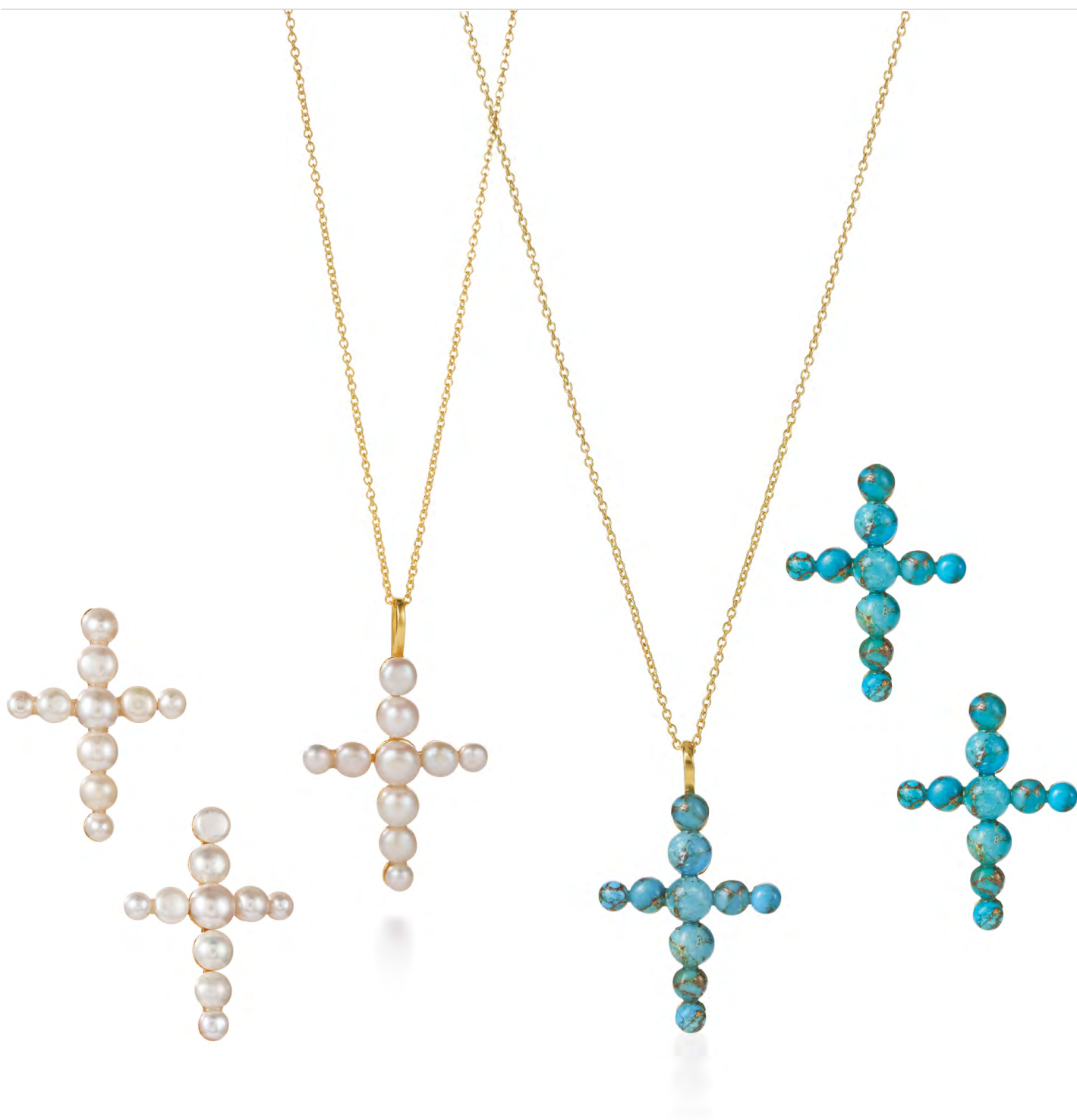
EG11-052 W: 59 € Cruz del Mar Earring Colour: Pearl/ icy ivory Length: 3 cm Sterling silver 24 carat gold plated