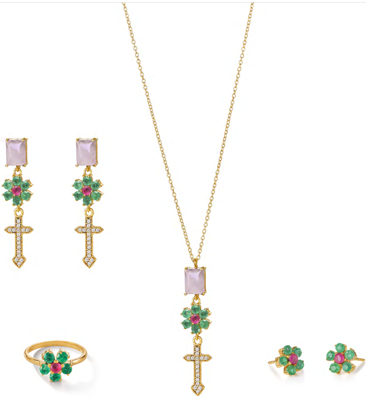
EG11-064 W: 59 € Kris Kross Earring Colour: mint leaves Length: 4 cm Sterling silver 24 carat gold plated Stones: Rose Quartz, Pink and Green Quartz, White Topaz