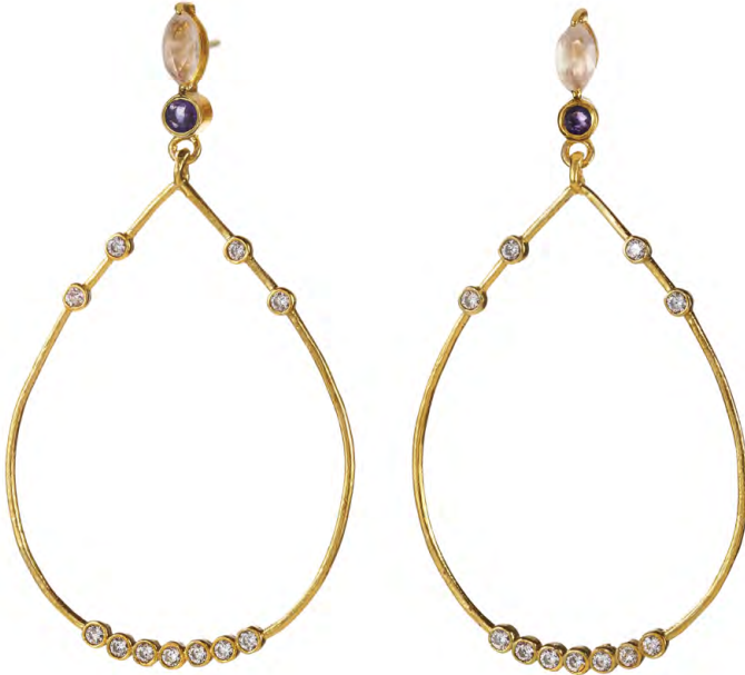
EG11-082 W: 54 € Dancing Queen Earring Colour: tender love Size: 65 mm Sterling silver 24 carat gold plated Stones: Rose Quarz, Amethyst, White Topaz