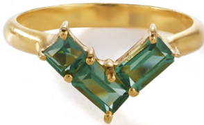
RG12-34 W: 36 € Satin Corner Ring Colour: shake that tree Stone size: 2 mm Sterling silver 24 carat gold plated Stone: Green Tourmaline

Ringgröße 50, 52, 54, 56 Size 5, 6, 7, 8