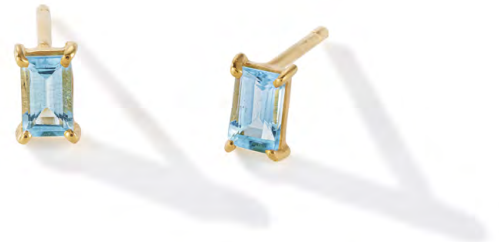
EG11-032 W: 35 € Savoy Ceremony Stud Colour: blissful blue Stone size: 5 x 3 mm Sterling silver 24 carat gold plated Stone: Light blue Topaz