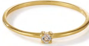
RG12-002 W: 19 € Birdie Ring Colour: clear as day Stone size: 2 mm Sterling silver 24 carat gold plated Stone: White Topaz