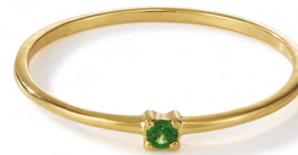
RG12-001 W: 19 € Birdie Ring Colour: shake that tree Stone size: 2 mm Sterling silver 24 carat gold plated Stone: Tsavorite/Green Garnet