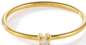
RG12-020 W: 19 € Birdie Ring Colour: playful white Stone size: 2 mm Sterling silver 24 carat gold plated Stone: Moonstone