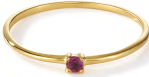
RG12-003 W: 19 € Birdie Ring Colour: cozy candy Stone size: 2 mm Sterling silver 24 carat gold plated Stone: Pink Tourmaline