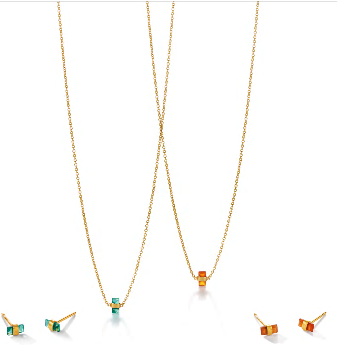
EG11-054 W: 28 € Tiny Melody Earring Colour: shake that tree Size: 7 mm Sterling silver 24 carat gold plated Stone: Green Tourmaline