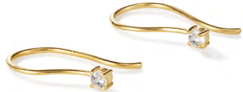
EG11-019 W: 22 € Midnight Glim Earring Colour: clear as day Length: 20mm Sterling silver 24 carat gold plated Stone: White Topaz