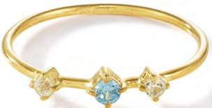
RG12-022 W: 24 € Broken Vintage Ring Colour: milky skylight Stone size: 2,5 / 2 mm Sterling silver 24 carat gold plated Stones: Blue Topaz & Moonstone

Ringgröße 50, 52, 54, 56 Size 5, 6, 7, 8