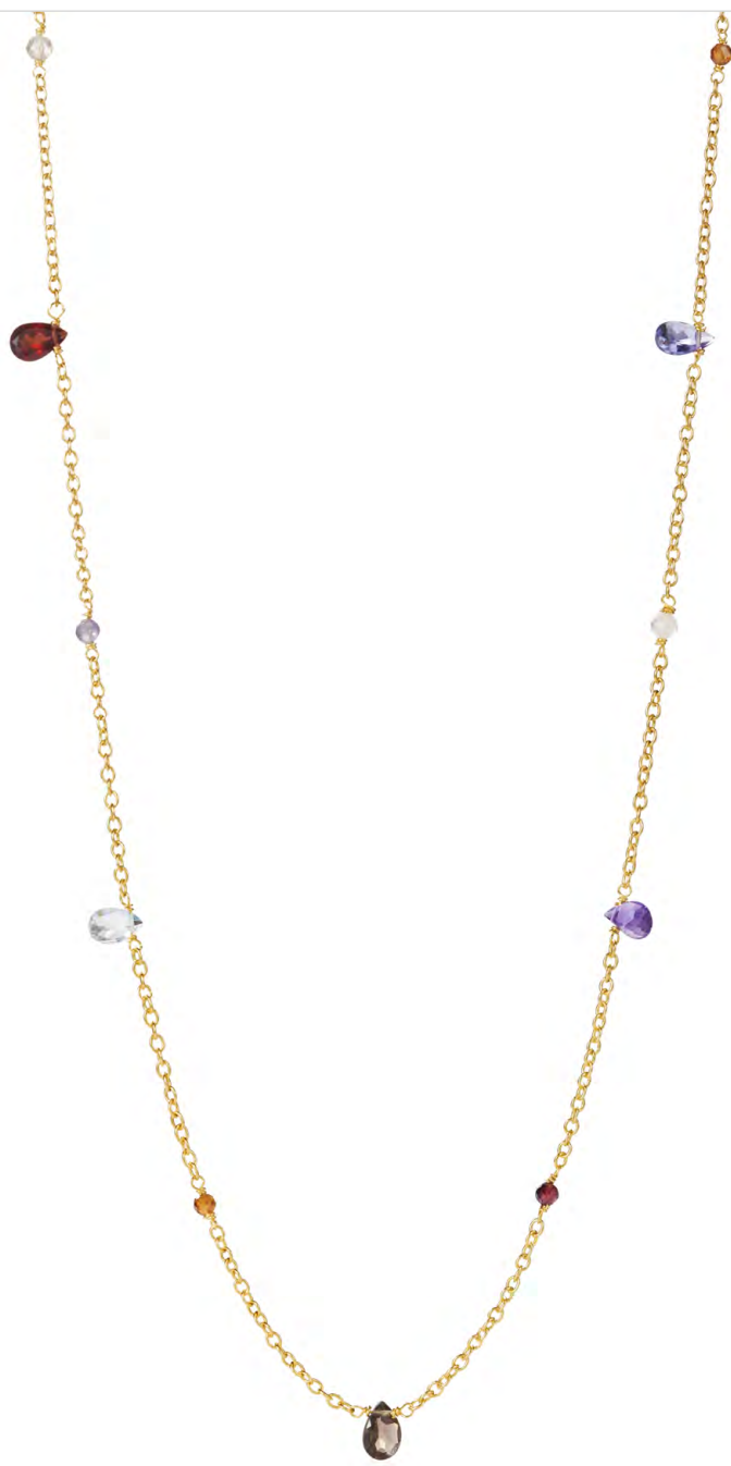
NG10-017 W: 36 € Velvet Garden Necklace Colour: vineyard Length: 18 inch (45 cm) Sterling silver 18 carat gold plated Stones: Amethyst, Blue Topaz, Peridot, Garnet, Crystal & Citrine