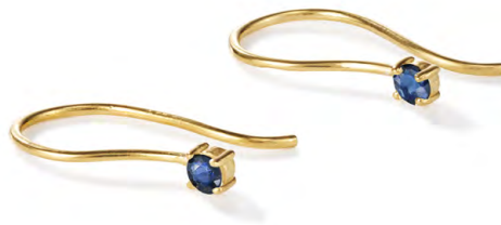
EG11-020 W: 22 € Midnight Glim Earring Colour: eccentric blue Length: 20mm Sterling silver 24 carat gold plated Stone: Blue Sapphire