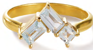
RG12-41 W: 36 € Satin Corner Ring Colour: blissful blue Stone size: 2 mm Sterling silver 24 carat gold plated Stone: Light blue Topaz