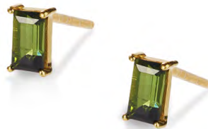
EG11-025 W: 35 € Savoy Ceremony Stud Colour: shake that tree Stone size: 5 x 3 mm Sterling silver 24 carat gold plated Stone: Green Tourmaline