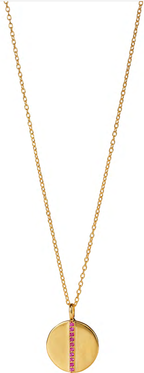
NG10-009 W: 45 € Flip a Coin Necklace Short Colour: cozy candy Length: 16/18 inch (40/45cm) Size: 15 mm Sterling silver 24 carat gold plated Stone: Pink Sapphire