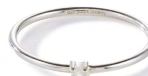
RS12-020 W: 15 € Birdie Ring Silver Colour: playful white Stone size: 2 mm 925 Sterling silver Stone: Moonstone