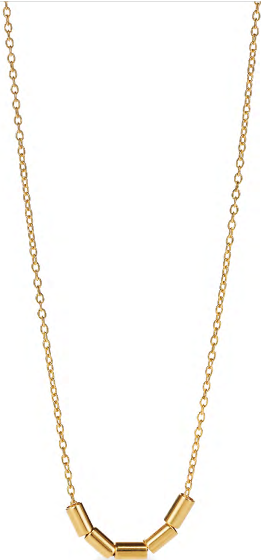
NG10-031 W: 33 € Sleek Serenade Necklace Colour: gold rush Length: 16/18 inch (40/45 cm) Size: 5 x 3 mm Sterling silver 24 carat gold plated