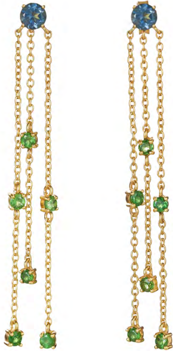
EG11-004 W: 59 € Clapping out Loud Earring Colour: flying peacock Length: 59 mm Sterling silver 24 carat gold plated Stones: London Blue Topaz & Tsavorite/ Green Garnet