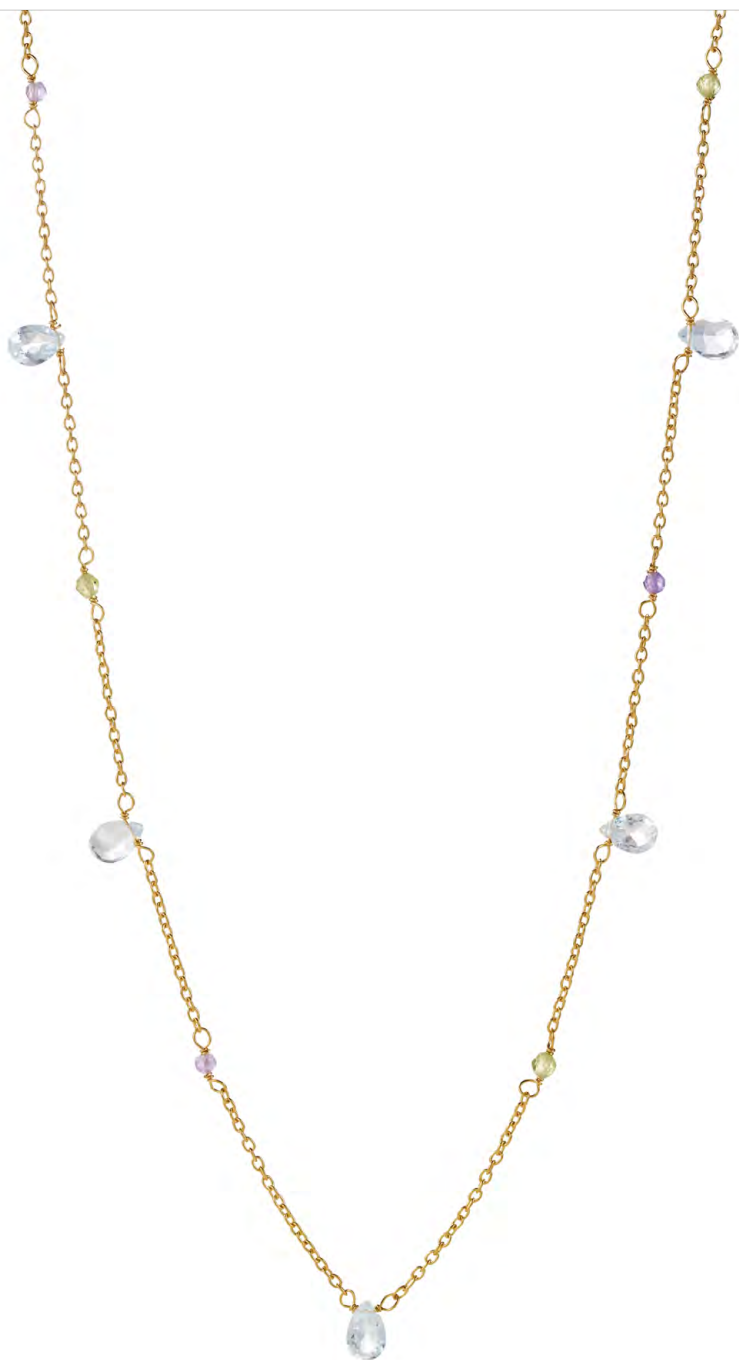
NG10-062 W: 42 € Velvet Garden Necklace Colour: light multi Length: 18 inch (45 cm) Sterling silver 18 carat gold plated Stones: Light Blue Topaz, Amethyst, Peridot