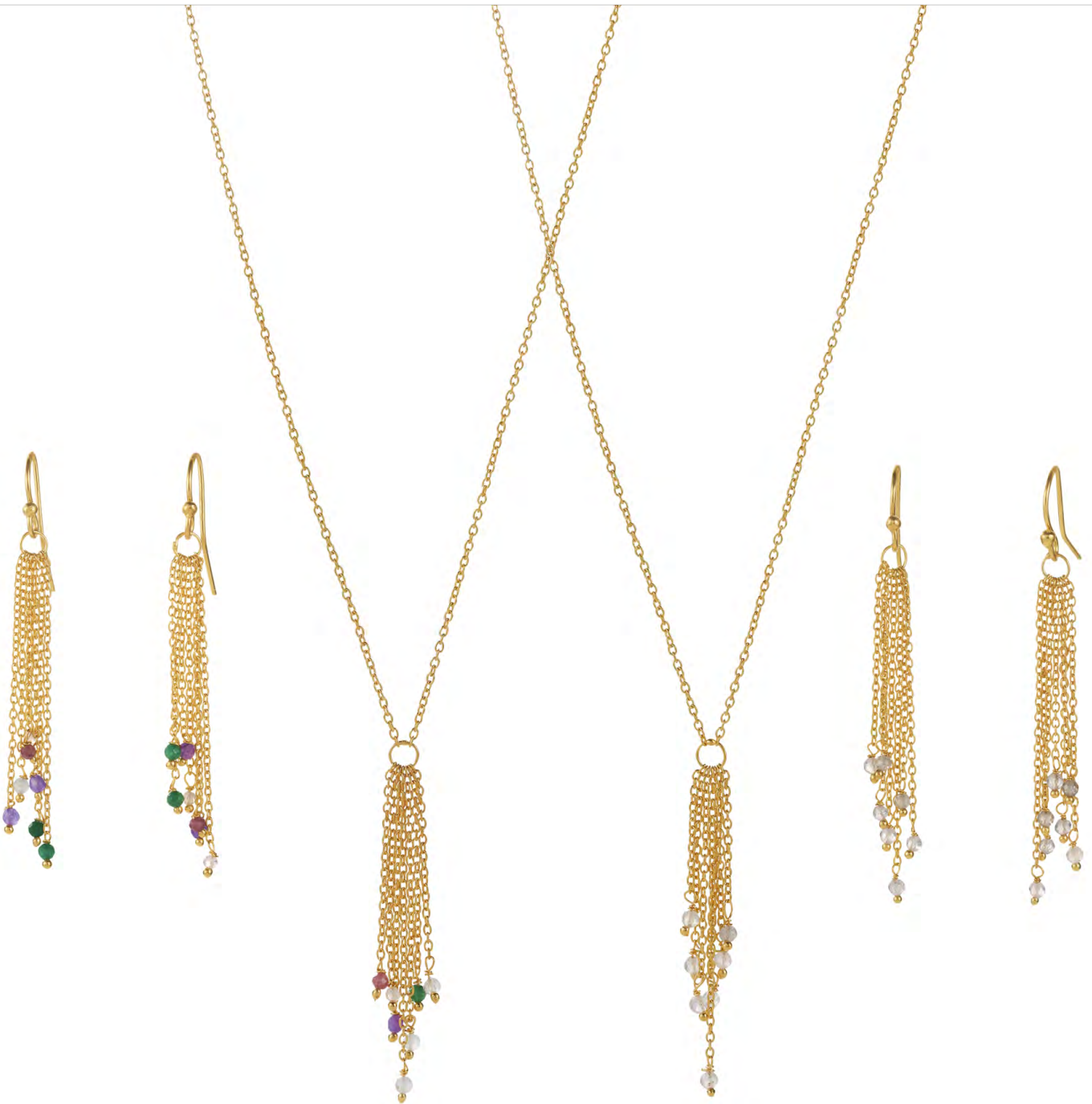
EG11-080 W: 30 € Fountain Earring Colour: multi Size: 6 cm Sterling silver 24 carat gold plated Stones: Moonstone, Amethyst, Green Onyx