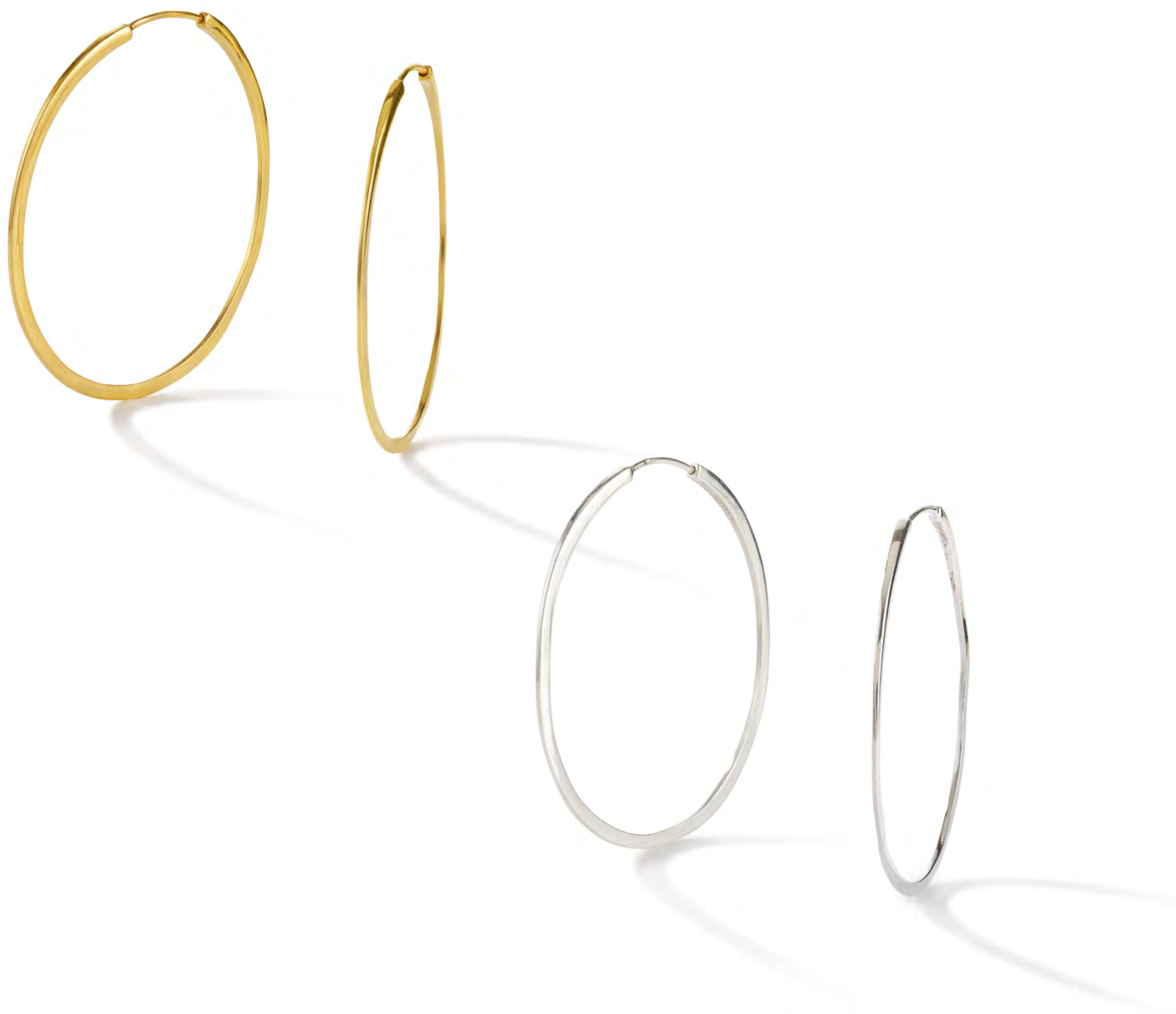
EG11-075 W: 35 € Shining Moon Earring Colour: gold rush Size: 45 mm Sterling silver 24 carat gold plated