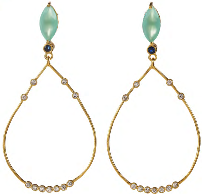
EG11-089 W: 54 € Dancing Queen Earring Colour: frozen icicle Size: 65 mm Sterling silver 24 carat gold plated Stones: Chalcedon, Lolite, White Topaz