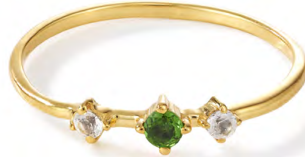
RG12-007 W: 24 € Broken Vintage Ring Colour: blueberry sorbet Stone size: 2,5 / 2 mm Sterling silver 24 carat gold plated Stones: Blue Sapphire & White Topaz