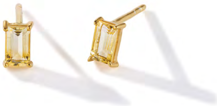
EG11-031 W: 35 € Savoy Ceremony Stud Colour: yummy yellow Stone size: 5 x 3 mm Sterling silver 24 carat gold plated Stone: Citrine