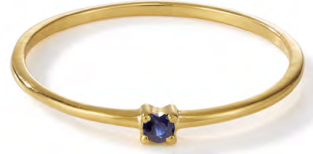
RG12-005 W: 19 € Birdie Ring Colour: eccentric blue Stone size: 2 mm Sterling silver 24 carat gold plated Stone: Blue Sapphire