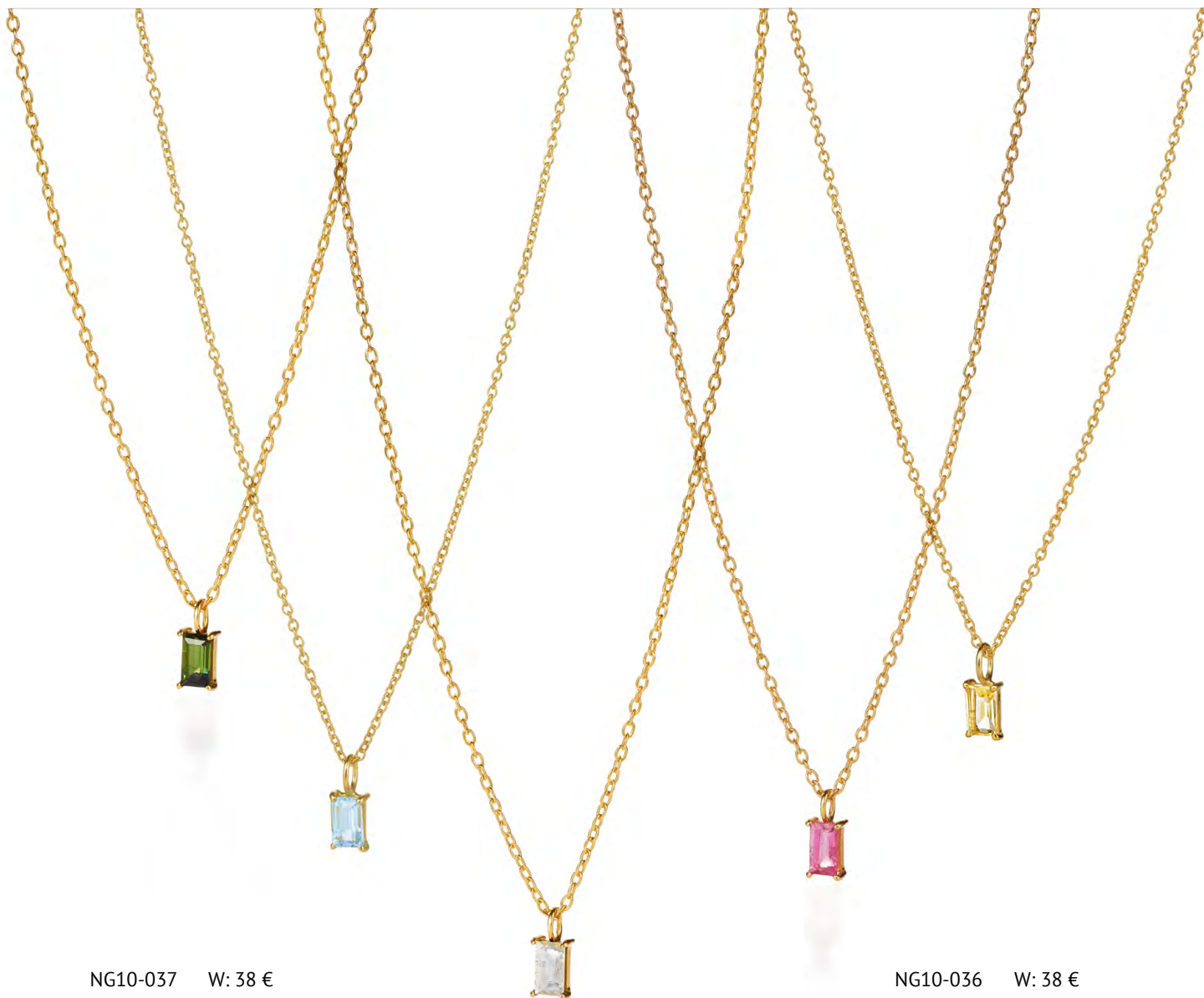
NG10-037 W: 38 € Savoy Ceremony Necklace Colour: blissful blue Length: 16/18 inch (40/45 cm) Size: 5 x 3 mm Sterling silver 24 carat gold plated Stone: Light blue Topaz