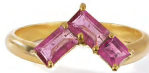
RG12-36 W: 36 € Satin Corner Ring Colour: cozy candy Stone size: 2 mm Sterling silver 24 carat gold plated Stone: Pink Tourmaline

Ringgröße 50, 52, 54, 56 Size 5, 6, 7, 8