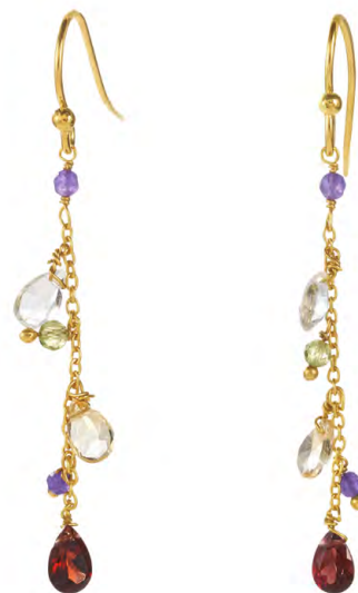
EG11-077 W: 36 € Velvet Garden Earring Colour: vineyard Length: 50 mm Sterling silver 18 carat gold plated Stones: Amethyst, Blue Topaz, Peridot, Garnet, Crystal & Citrine