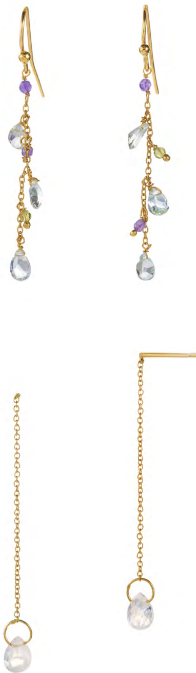
EG11-078 W: 36 € Velvet Garden Earring Colour: light multi Length: 50 mm Sterling silver 18 carat gold plated Stones: Light Blue Topaz, Amethyst, Peridot