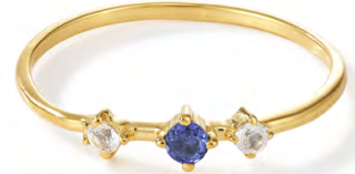
RG12-006 W: 24 € Broken Vintage Ring Colour: gooseberry sorbet Stone size: 2,5 / 2 mm Sterling silver 24 carat gold plated Stones: Tsavorite/Green Garnet & White Topaz