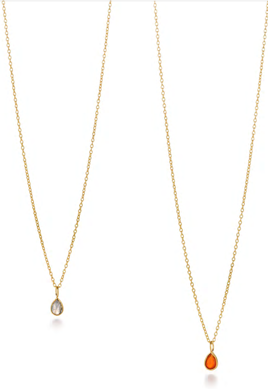
NG10-045 W: 32 € Last Drop Necklace Colour: gloomy lights Length: 16/18 inch (40/45 cm) Sterling silver 24 carat gold plated Stone: Labradorite