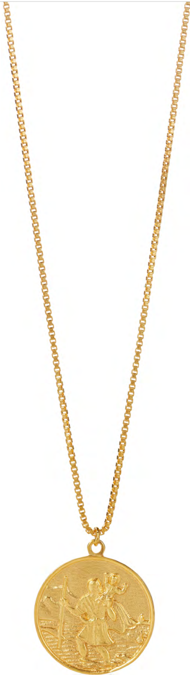
NG10-044 W: 48 € Bon Voyage Necklace Colour: gold rush Length: 16/18 inch (40/45 cm) Sterling silver 24 carat gold plated