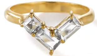
RG12-35 W: 36 € Satin Corner Ring Colour: clear as day Stone size: 2 mm Sterling silver 24 carat gold plated Stone: White Topaz