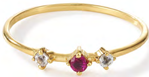
RG12-008 W: 24 € Broken Vintage Ring Colour: raspberry sorbet Stone size: 2,5 / 2 mm Sterling silver 24 carat gold plated Stones: Pink Tourmaline & White Topaz